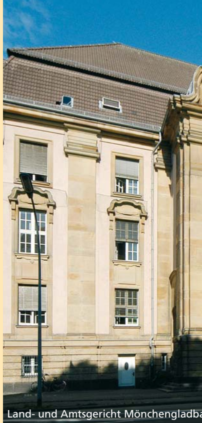
Land- und Amtsgericht Mönchengladbach